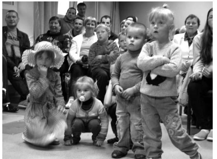
Kurkliuose į Joninių šventę susirinko ir pats jauniausias miestelio jaunimas.

Kurklių kultūros namuose pilną žiūrovų salę linksmo Panevėžio rajono Tiltagalio linijinių šokių grupė „Širšės“ bei buvusio rajono Tarybos Antikorupcinės komisijos