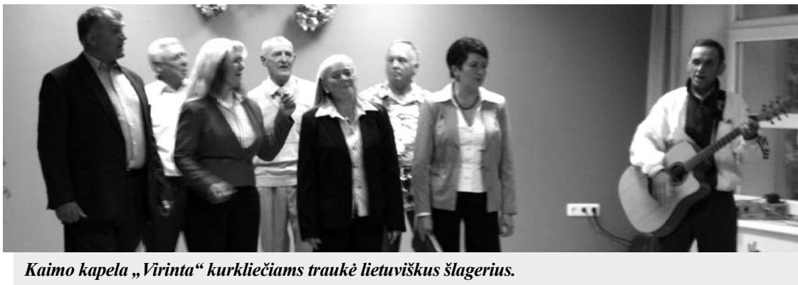
Kaimo kapela „Virinta“ kurkliečiams traukė lietuviškus šlagerius.