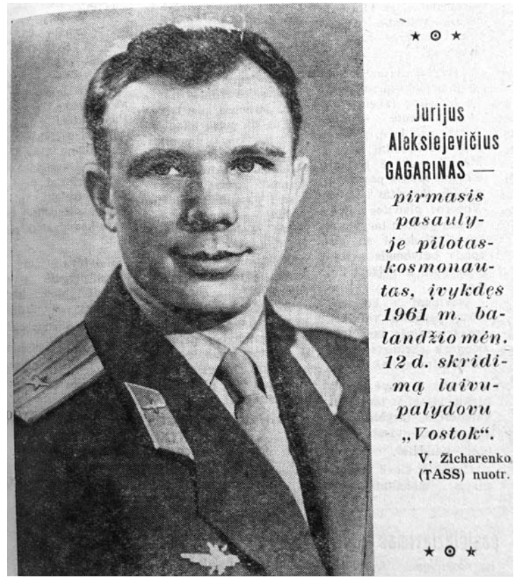
Po skrydžio į kosmosą, pirmajame „Kolektyvinio darbo“ puslapyje atsidūrė kosmonautas Jurijus Gagarinas.

1961 metų balandžio 13 dieną, kitą dieną po J.Gagarino skrydžio į kosmosą, „Kolektyvinis darbas“ darbas pirmame puslapyje, virš pavadinimo pasitiko užrašu: „Vakar, 1961 metų balandžio 12 d., Tarybų Sąjungoje išvestas į orbitą aplink Žemę kosminis laivas – palydovas „Vostok“ su žmogumi“. Toliau sekė