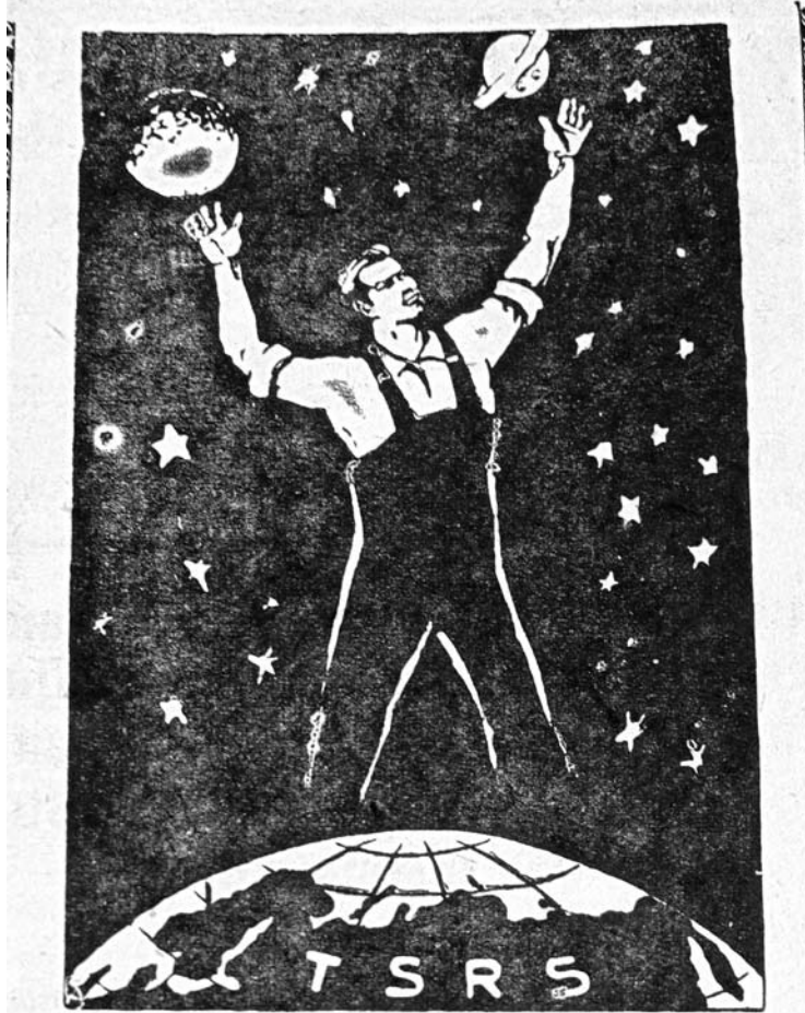
Tarybinis žmogus — kosmoso užkariautojas

Du esminiai įvykiai pradėję kosmoso erą prasidėjo Tarybų sąjungoje. 1957 metais paleistas pirmasis dirbtinis Žemės palydovas „Sputnik“, o 1961 metais į kosmosą pakilo pirmasis žmogus – Jurijus Gagarinas. Natūralu, kad tokie įvykiai negalėjo neatsispindėti ir rajoninėje spaudoje.