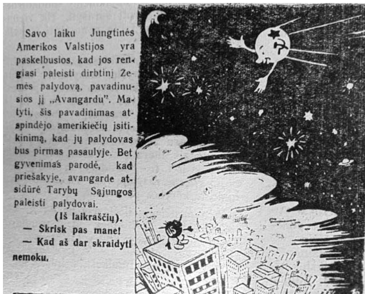
Amerikiečių erzinimas ir tyčiojimas iš jų dėl kosminės programos buvo neretas reiškinys.

Šią kovą TSRS pralaimėjo. 1969 metų liepos 20 dieną Mėnulyje išsilapino amerikiečių astronautai. „Kolektyviniame darbe“ apie tai – nei žinutės. Lipos 22 dieną laikraštis išsina kaip nieko neįvykus: Pirmajame puslapyje rašoma apie pavyzdinį kolūkių įstatų projektą, žinutės, jog agronomė patenkinta darbais, tekstilinių linkėjimais. Vaizdas nepakito ir kituose laikraščiuose. Apie amerikiečius, kuriuos taip išjuokinėjo straipsnyje apie „Sputniką“ A.Aleksandrovas, nebuvo jokių žinių. Paradoksas, kad pradžioje demonstravusi pranašumą kosminėje srityje, tuo erzinusi amerikiečius, galiausiai TSRS žlugo iš dalies, kaip vertina kai kurie istorikai, dėl to, kad JAV pradėjus „Žvaigždžių karų“ programą, skirtą kovai su TSRS raketomis, jos išlaidų socializmo bastionas galiausiai neatlaikė ir žlugo.